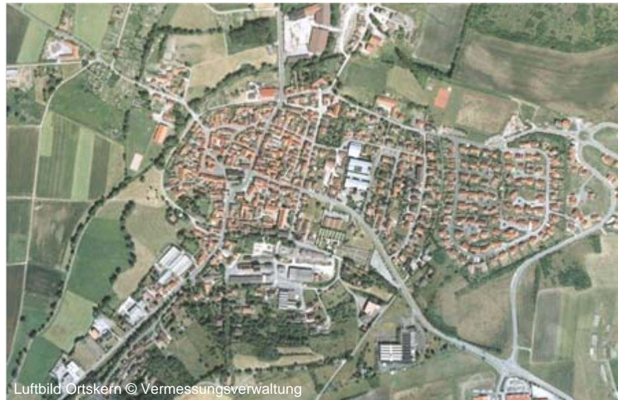
Luftbild Ortskern © Vermessungsverwaltung

Regierung von Unterfranken Sachgebiet Städtebau