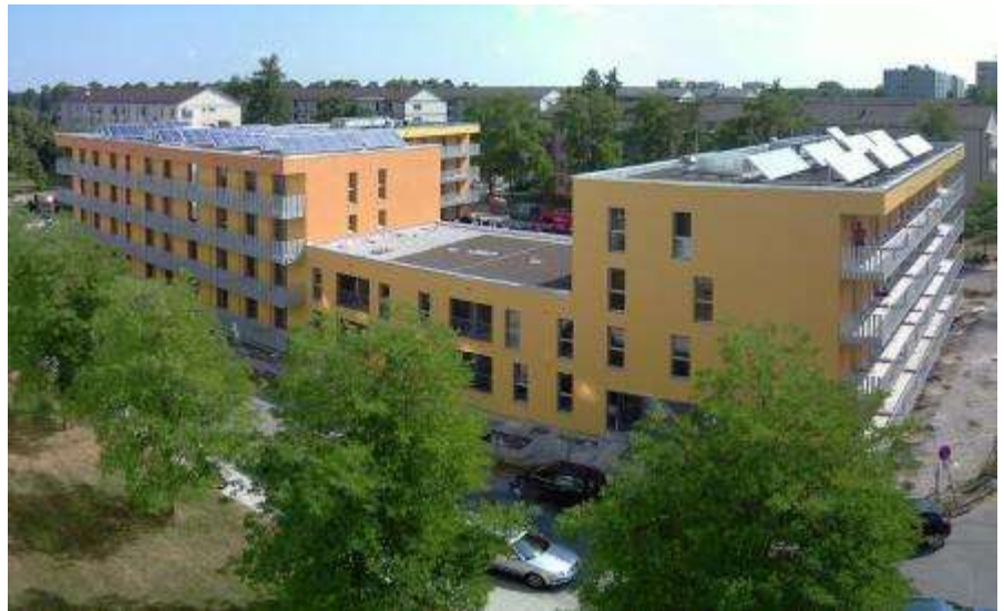
Ansicht von Südwesten