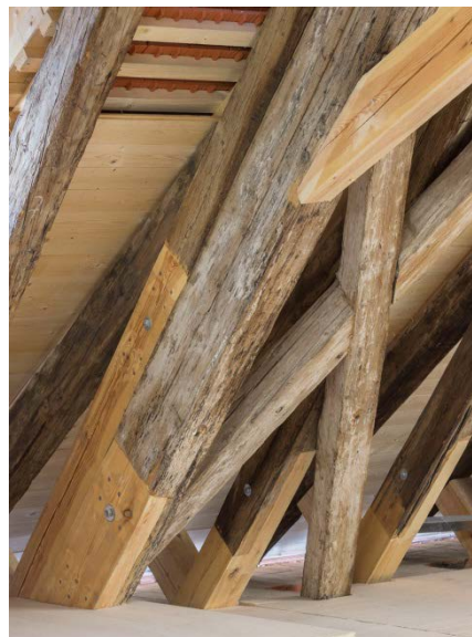
Detail Dachstuhl