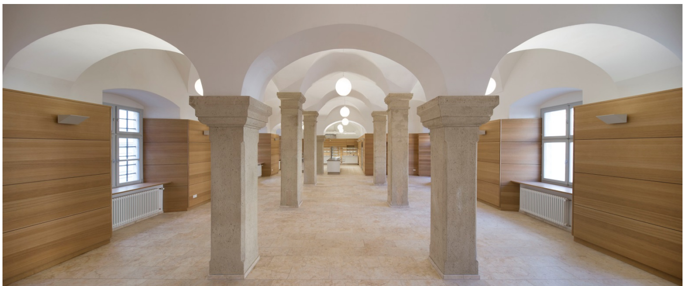
Kantine mit Speiseausgabe