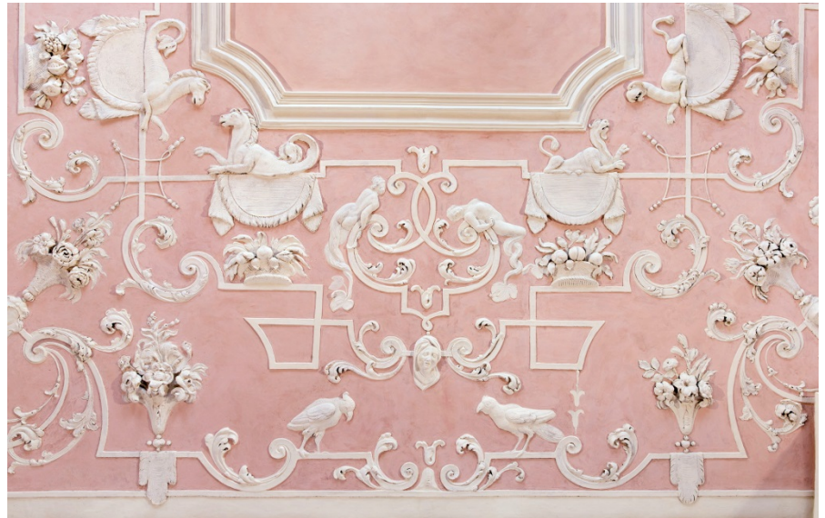
Stuckdecke v. Peter Franz Appiani

Grundlage für die nun gegebene barrierefreie Erschließung war u.a. sowohl der Einbau mehrerer Liftanlagen als auch die Sanierung der Parkplatzflächen im Innenhof. In energetischer Hinsicht konnte durch die Dämmung des Dachgeschosses, die Ertüchtigung der Fassade und eine Neuinstallation der Heizungsanlage der Gesamtenergieverbrauch deutlich reduziert werden.