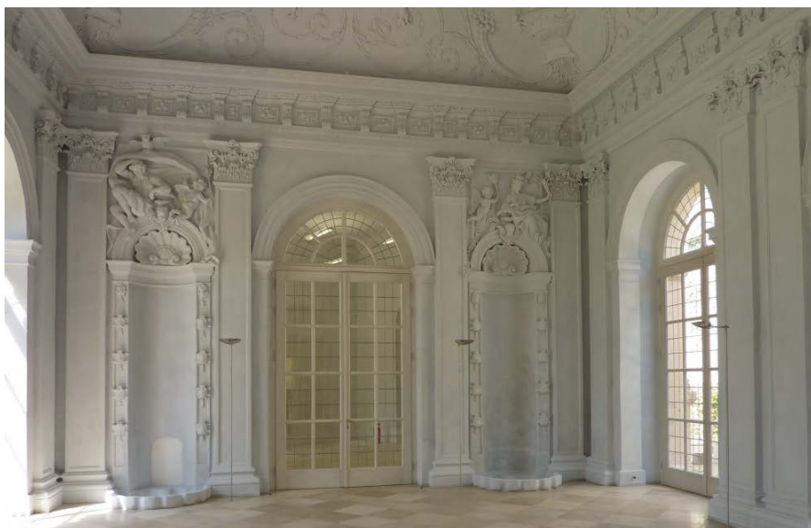
Wasserraum in monochromem Grau

Die Institute für Kunstgeschichte und Kirchenmusik erhalten attraktive Räume zurück. Die Universität gewinnt einen wichtigen repräsentativen Veranstaltungsort, der zudem von der Stadt für Trauungen als auch von Privaten für feierliche Anlässe gemietet werden kann.