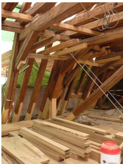
Sanierung des Dachstuhl