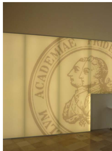
Lichtwand im Foyer