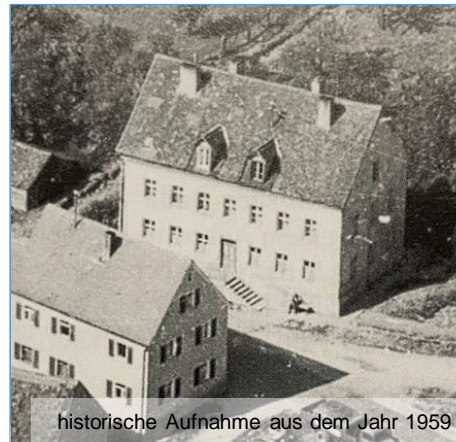
historische Aufnahme aus dem Jahr 1959

Die Maßnahme wurde durch ein breites Engagement der Bürgerinnen und Bürger mitgetragen und stellt nicht nur baulich durch die Sanierung und Belegung des Leerstands in der Ortsmitte, sondern auch sozial eine Bereicherung für den Ort da. Auch die neuen Bewohner profitieren von der schnellen Integration in die lebendige Gemeinschaft.