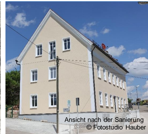
Ansicht nach der Sanierung