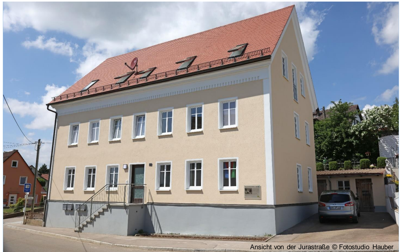
Ansicht von der Jurastraße