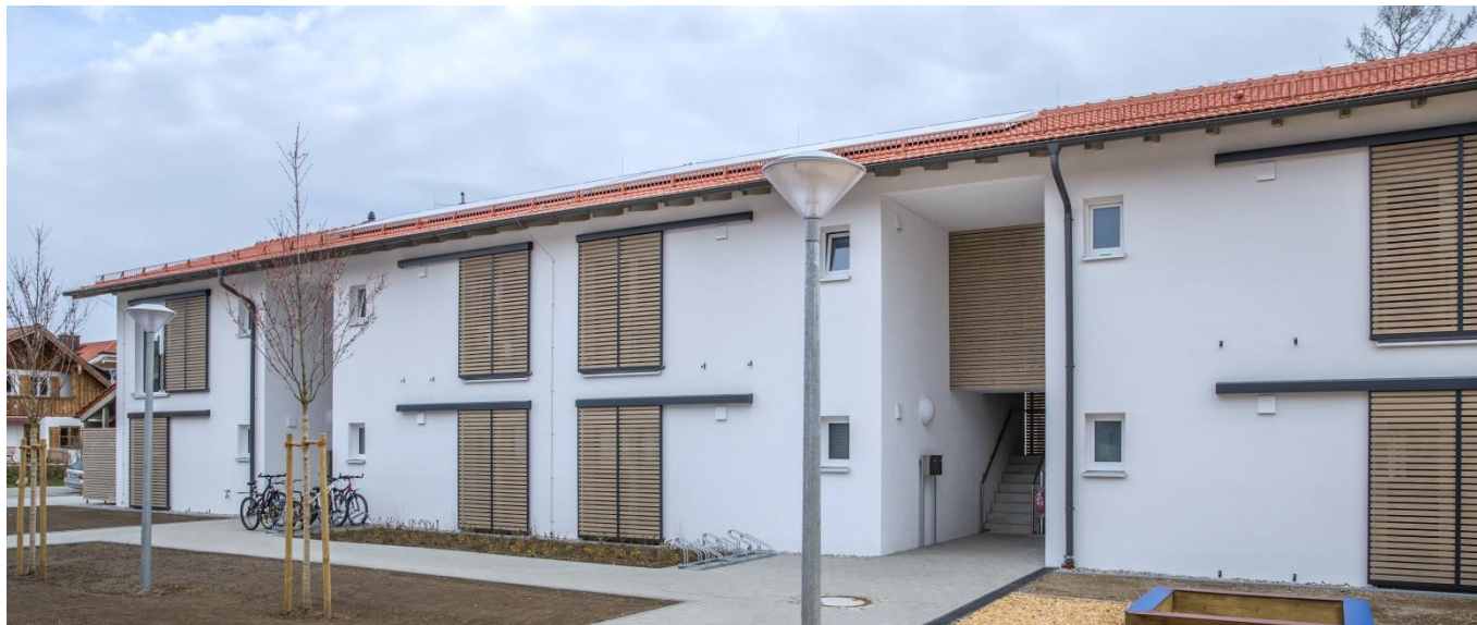
Haus 2, Ansicht West