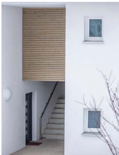
Zugang Wohngebäude