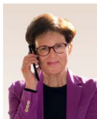
Gudrun Brendel-Fischer Povjerenica za integracije bavarske Državne vlade