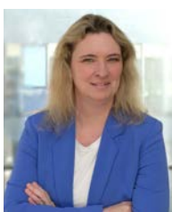
Kerstin Schreyer Bayerische Staatsministerin für Wohnen, Bau und Verkehr