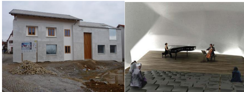
Das „Blaue Haus“ als erstes Impulsprojekt nach der Fertigstellung sowie eine Vision des Konzerthauses

Im Rahmen des Beteiligungsverfahrens ist die Idee zum ersten Blaibacher Impulsprojekt entstanden: Viele Jahre hatte das leerstehende und zunehmend baufällige sog. „Blaue Haus“ die städtebauliche Situation im Ortszentrum beeinträchtigt. Im Mai 2013 konnte die Modellkommune den Sitz der Gemeindeverwaltung in das zentral gelegene, grundlegend sanierte und erweiterte Gebäude verlegen, das durch seine moderne Architektur – das Gebäude wurde mit einem Mantel aus hellem Glasbeton versehen, die puristische Innengestaltung ist durch Beton, Holz und Glas geprägt – weit über Blaibach hinaus Beachtung findet.