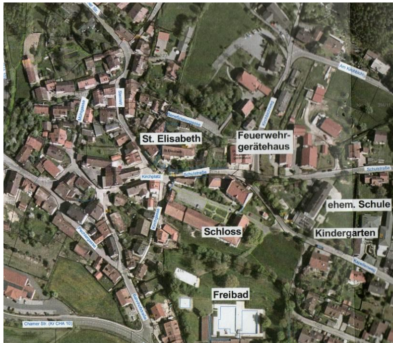
Ortszentrum Blaibach

Landkreis: Cham Regierungsbezirk: Oberpfalz Einwohner: 1.980 (31.12.2011) Projekttitle: Rettung Ortszentrum Blaibach Größe des Projektgebiets: ca. 0,5 ha.